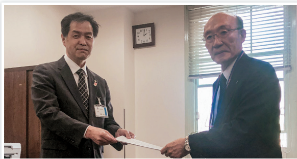
大阪市 新谷健康局長(右) ◀