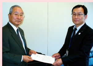
大阪市 山口 健康局長(右)