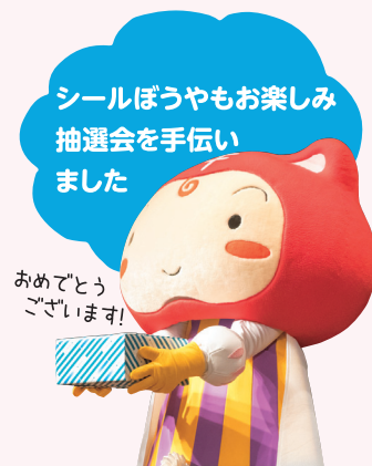
お楽しみ抽選会の様子