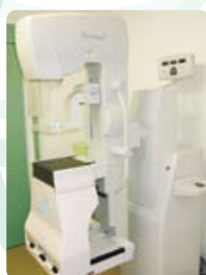
マンモグラフィ装置