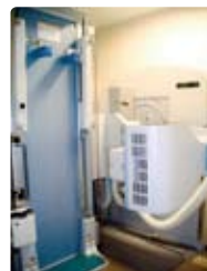
胃部エックス線装置